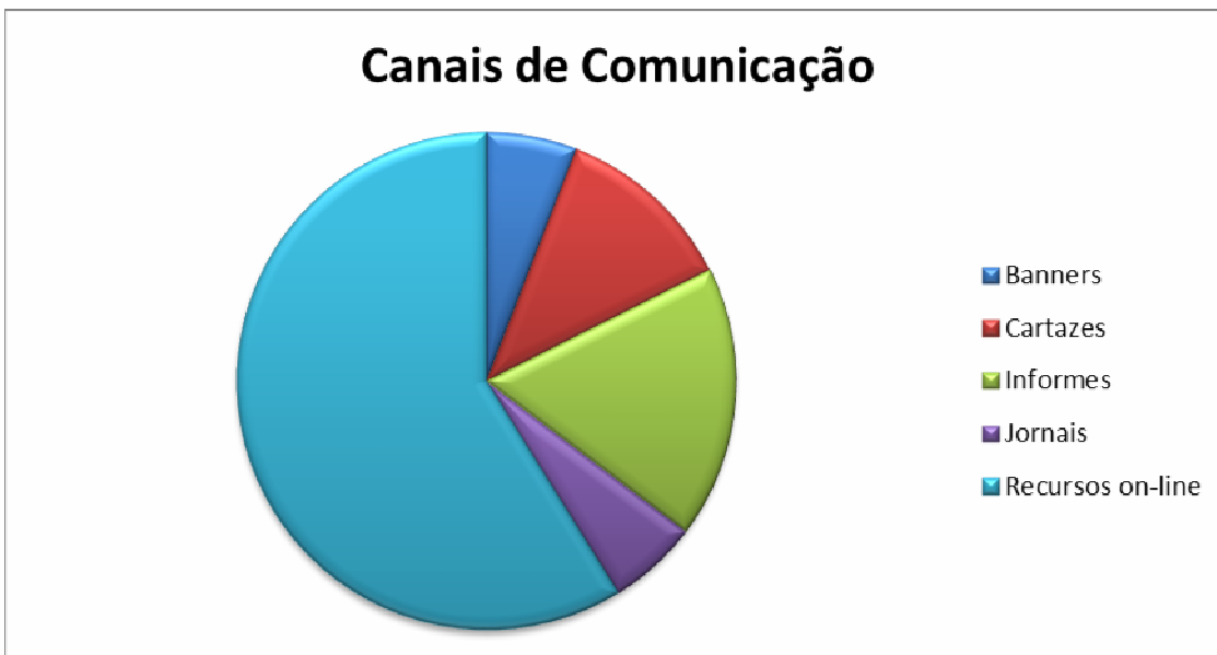
GRÁFICO 1 – Frequência do Uso dos Canais Comunicacionais na UFG-RC