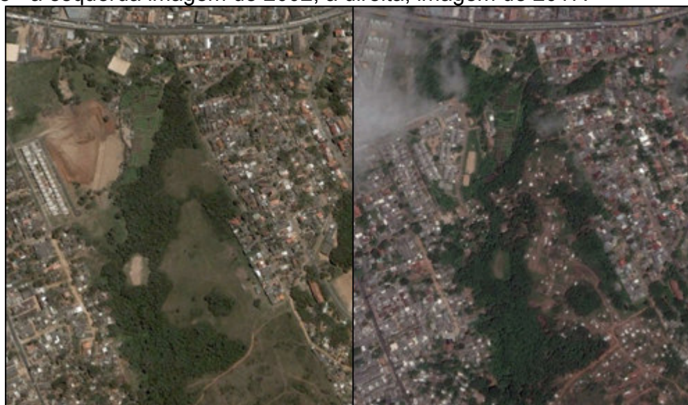
FIGURA 3. Modificação evolutiva de parte da área do bairro Partenon ao longo de 15 anos - a esquerda imagem de 2002; a direita, imagem de 2017.

Fonte: modificado do Google Earth - imagens sem escala.