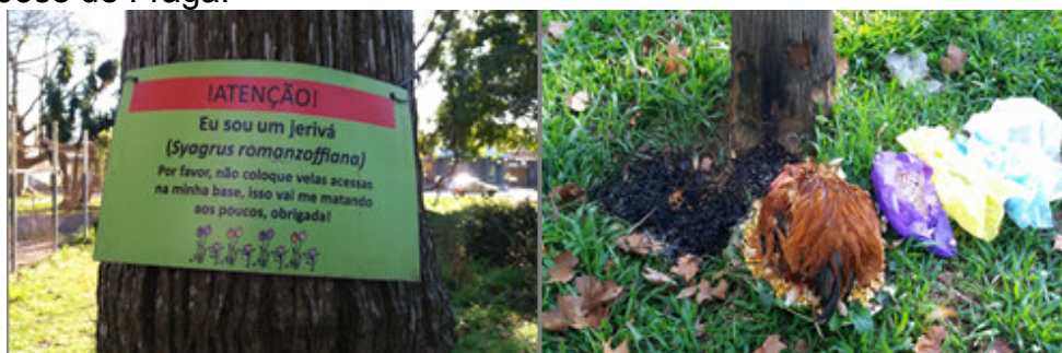
FIGURA 5. O pedido de membro da comunidade e a resposta religiosa. Praça Cel. Tristão José de Fraga.

Desta forma, diferentes interações com o restante do meio ambiente social que se utilizam do espaço público ocorrem. Por exemplo, na Praça Cel. Tristão José de Fraga se percebe certo nível de embate, no que tange a forma de uso do espaço público, como se observa na figura 5.