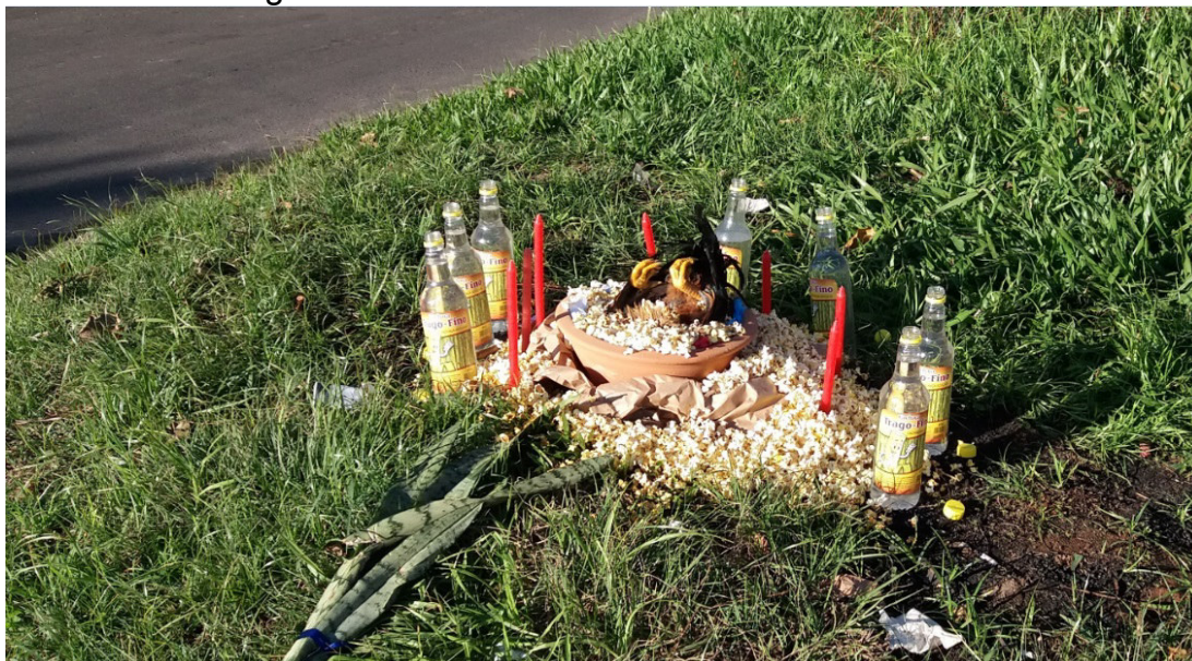
FIGURA 10. Canteiro central da Avenida Elias Cirne Lima junto ao cruzamento com a Rua Dr. Telmo Vergara.