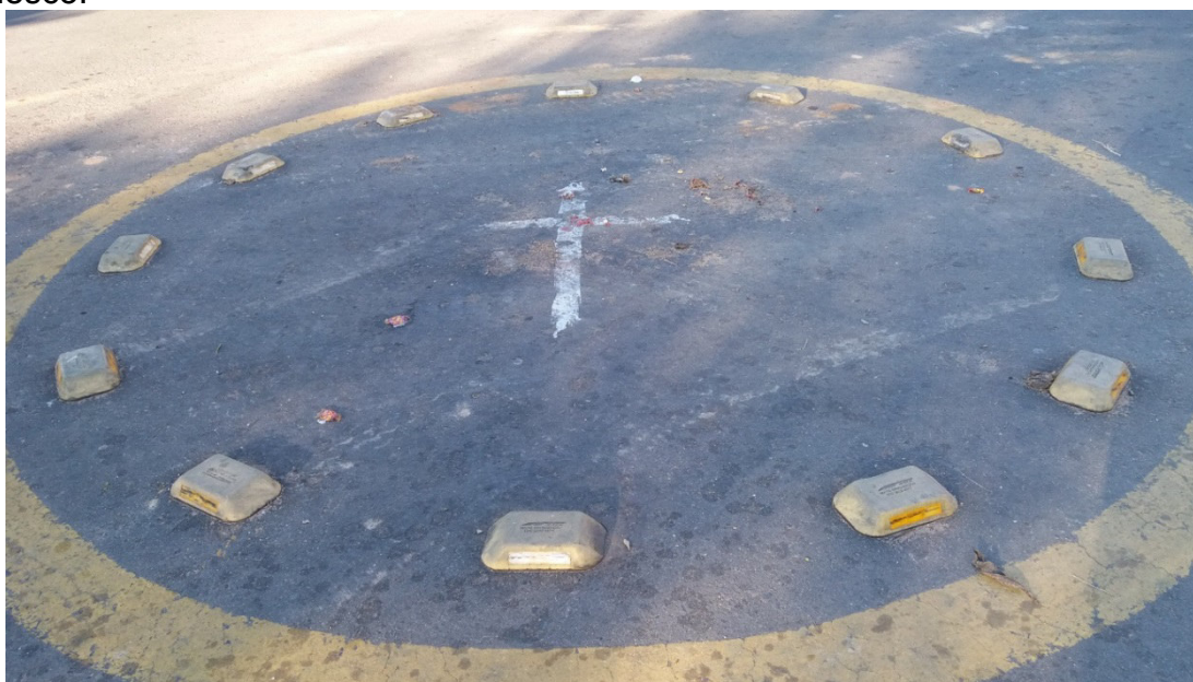
FIGURA 4. Rotatória no cruzamento da Avenida Elias Cirne Lima e Rua Padre Todesco.

A paisagem religiosa expressada no contexto do espaço público de um conjunto de vias (figs. 2 e 4) revela-se através de símbolos religiosos, que exercem uma demarcação de território para poder traduzir os valores e crenças das pessoas. Aos olhos dos fiéis é considerada como um ambiente sagrado, ou seja, como espaço onde eles se comunicam com forças sobrenaturais. Invocando-as, ou até mesmo dedicando por meio de cultos, preces como forma de reverência ao seu ser supremo. A forma de se cultivar depende de cada segmento religioso.