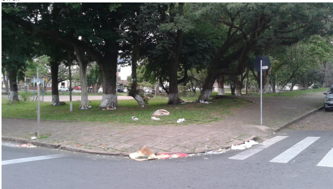
FIGURA 2. Oferenda no cruzamento da Avenida Elias Cirne Lima e Rua Artur de Oliveira.

Sendo a paisagem o que se vê, supõe-se necessariamente a dimensão real do concreto, o que se mostra, e a representação do sujeito, que codifica a observação. A paisagem resultado desta observação é fruto de um processo cognitivo, mediado pelas representações do imaginário social, pleno de valores simbólicos. A paisagem apresenta-se assim de maneira dual, sendo ao mesmo tempo real e representação (CASTRO, 2002). Assim, o espaço público, enquanto elemento constitutivo da paisagem urbana, abre caminho para as manifestações públicas, religiosas (especialmente as africanistas), associado ao simbolismo implicitamente presente, por exemplo, um cruzamento de vias (figs. 2 e 4).