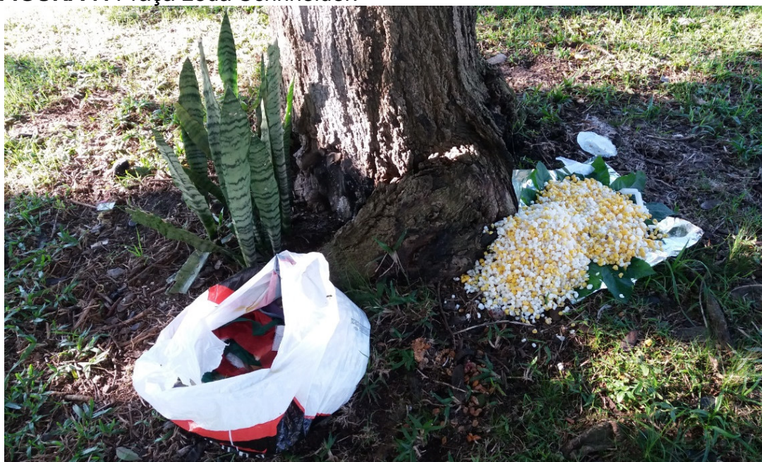
FIGURA 7. Praça Leda Schneider.

Percebe-se, desta maneira, por um lado, a relação direta entre o uso do espaço e a ocorrência de manifestações religiosas e, por outro, uma coexistência entre os usos para manifestações africanistas de cunho religioso e os demais empreendidos pela comunidade do entorno. Em que pese o aspecto cultural, observado através do contato com sacerdotes africanistas, não há o hábito de realizar entregas de oferendas em áreas do entorno do próprio Ilê, com isto evitando possíveis conflitos com a própria vizinhança. Tais relações, entretanto, podem não ocorrer em plena pacificidade, mas é evidenciada. Por outra ótica, observa-se que a apropriação do espaço por meio das manifestações religiosas supramencionadas, se dá justamente no setor em que evidencia uma menor propensão aos conflitos culturais; evitando situações como a da Praça Cel. Tristão José de Fraga (fig. 7).