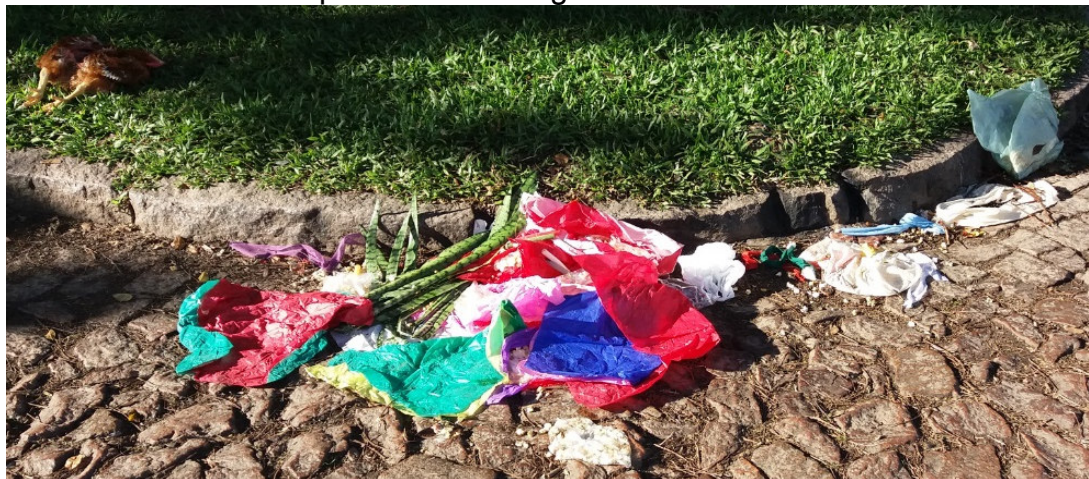
FIGURA 8. Oferenda junto à Praça Leda Schneider, na esquina das ruas Dr. Pereira da Cunha com Cap. Pedro Werlang.