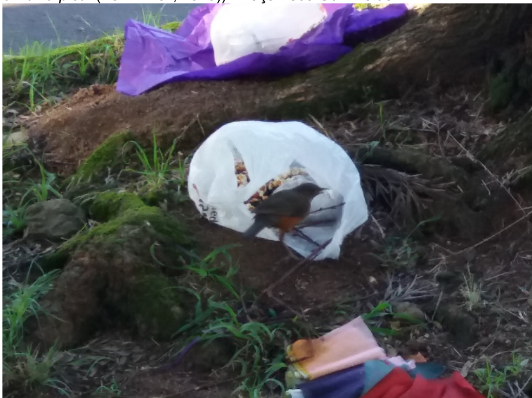
FIGURA 9. Oferendas servindo de alimento para avefauna - foram contabilizados na área, alimentando-se em tais resíduos religiosos, 28 sabiás ( Turdus rufiventris Vieillot, 1818), 17 pombos-domésticos ( Columba livia Gmelin, JF, 1789) e 29 rolinhas ( Columbina picui (Temminck, 1813)). Praça Leda Schneider.