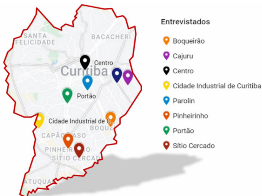
FIGURA 1. Localização das associações de catadores entrevistadas em Curitiba/PR.

Com isso, a pesquisa sobre o ciclo de vida do vidro foi realizada via e-mail com duas representantes do poder público, lotadas no Departamento de Educação Ambiental da Secretaria Municipal da Educação (SME) e no Departamento de Limpeza Pública da Secretaria Municipal do Meio Ambiente (SMMA), além de, via telefone, com 16 (dezesseis) associações de catadores de recicláveis atuantes nos bairros Boqueirão (3), Cajuru (1), Centro (Matriz) (3), Cidade Industrial de Curitiba (CIC) (4), Parolin (2), Pinheirinho (1), Portão (1) e Sítio Cercado / Bairro Novo (1), distribuídas no município conforme apresentado na Figura 1.