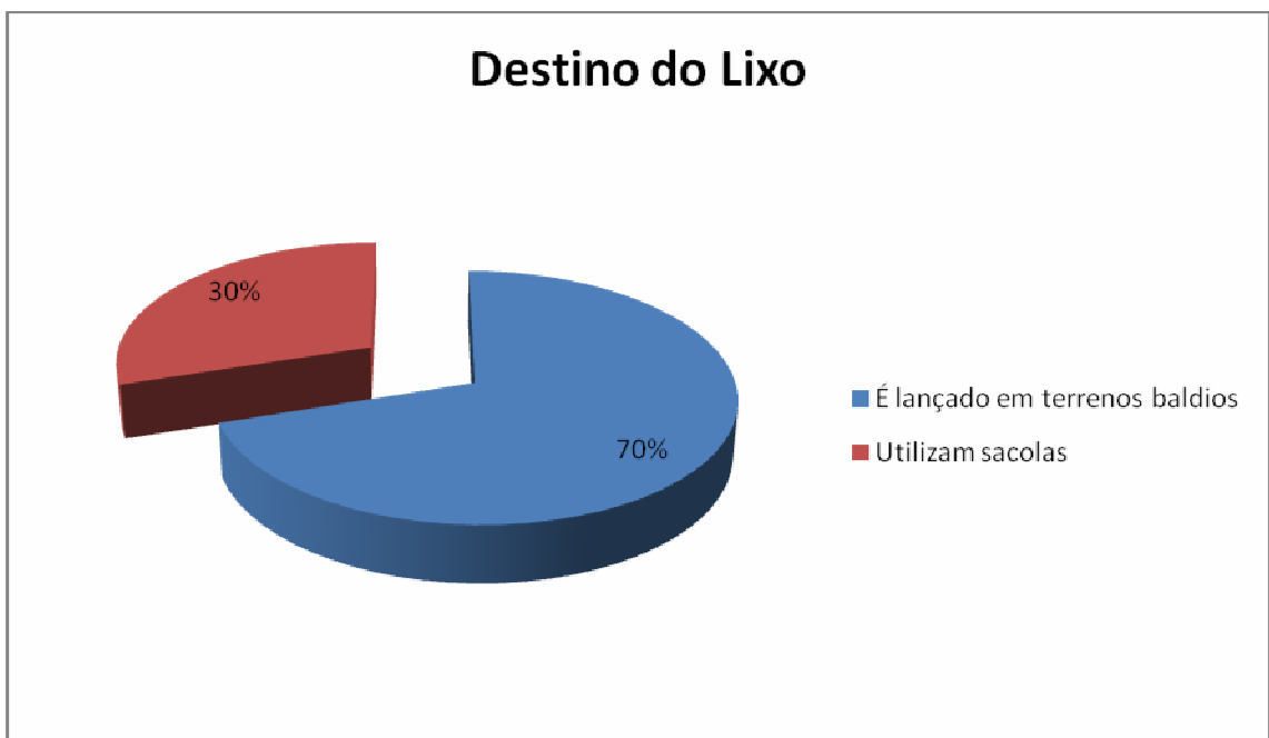
FIGURA 3: Destino do lixo

Acerca do destino do lixo, 70% disseram que os resíduos sólidos são lançados em terrenos baldios, pois não existe coleta de lixo diária na área e 30% utilizam sacolas para destinar lixo em área tida como apropriada como depósito, com isso é possível dizer que lançamento de lixo contribui para alterar a qualidade da água dessa área. Os poluentes percolam através do solo e atingem os mananciais. Esta representação pode ser vista na Figura 3.