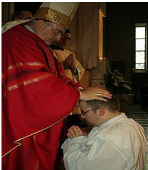
FIGURA 01: Momento da Ordenação de um Diácono

Um diácono (do grego antigo διάκονος , “ministro”, “ajudante”) são os ajudantes dos líderes de uma igreja particular local, e por sua vez, aspirantes a futuros líderes. Possui o primeiro grau do Sacramento da Ordem, sendo ordenado não para o sacerdócio, mas para o serviço da caridade e da proclamação da Palavra de Deus e da liturgia.